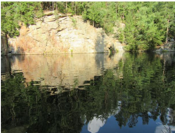
... zwischendurch mal baden gehen...