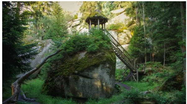
... und vieles andere mehr....