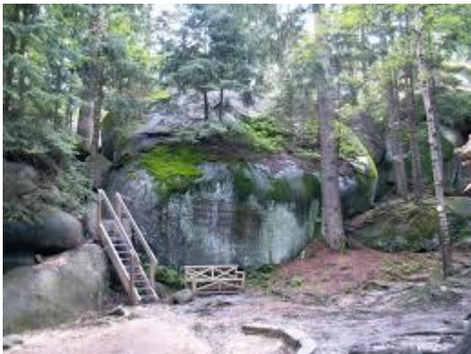
... und natürlich ins Felsenlabyrinth