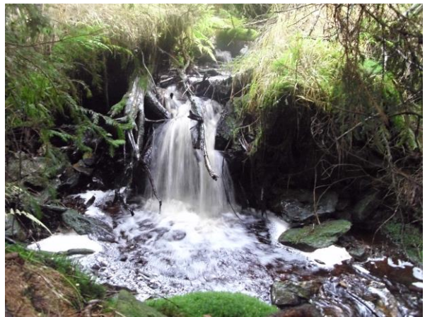
...dem Lauf wilder Bäche folgen...