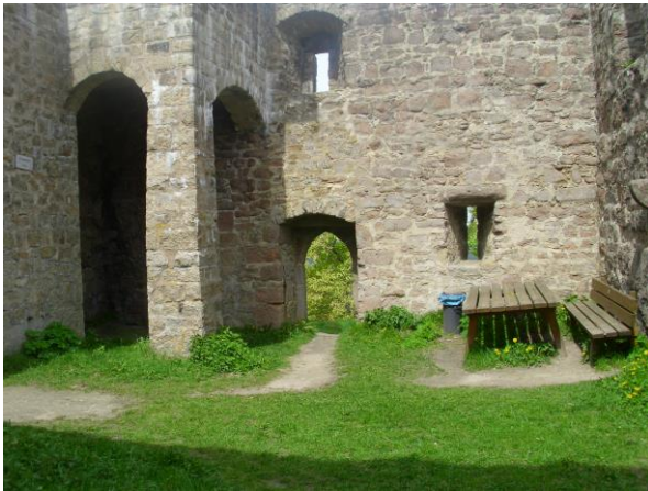
... zur Rast zwischen Burgmauern